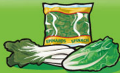
Légumes feuillus Cuits : 125 mL (½ tasse) Crus : 250 mL (1 tasse)