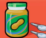
Beurre d'arachide ou de noix 30 mL (2 c. à table)