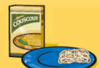
Pâtes alimentaires ou couscous, cuits 125 mL (½ tasse)