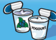
Yogourt 175 g (¾ tasse)