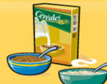
Céréales Froides : 30 g Chaudes : 175 mL (½ tasse)