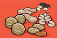
Noix et graines écalées 60 mL (¼ tasse)