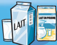
Lait ou lait en poudre (reconstitué) 250 mL (1 tasse)