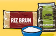
Riz, boulgour ou quinoa, cuit 125 mL (½ tasse)