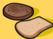
Pain 1 tranche (35 g)