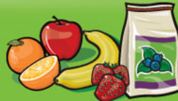
Fruits frais, surgelés ou en conserve 1 fruit ou 125 mL (½ tasse)