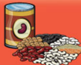
Légumineuses cuites 175 mL (¾ tasse)