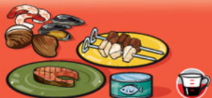
Poissons, fruits de mer, volailles et viandes maigres, cuits 75 g (2 ½ oz)/125 mL (½ tasse)