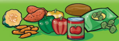
Légumes frais, surgelés ou en conserve 125 mL (½ tasse)